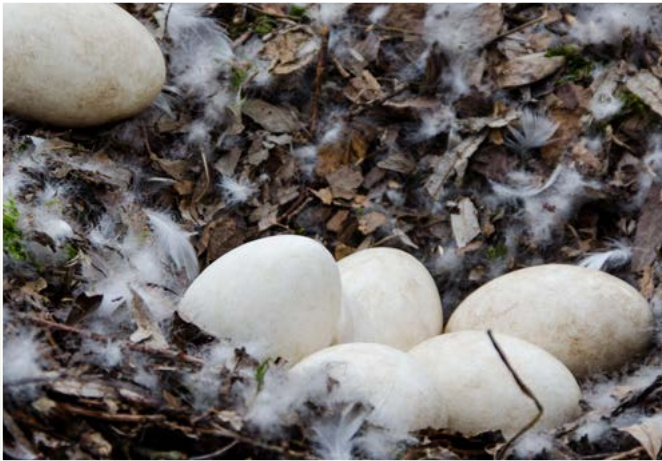
'Het vinden van alle ganzennesten is een onmogelijke taak'

Ook Verkaik is goed gestemd over de nieuw ingeslagen weg. 'De afgelopen vijf jaar is er veel gemopperd en werd elkaar de zwarte piet toegeschoven. Daar zijn we nu eindelijk van af. We zullen altijd veel ganzen houden in Nederland. Met ons groene grasland en plassen is het een ideaal gebied voor hen. Dat is mooi, maar het is uit de hand gelopen. Definitieve oplossingen bestaan in dit geval niet, maar dat hoeft ook niet zolang we het maar kunnen beheersen en hanteren. De laatste jaren ben ik 95% van mijn tijd als WBE-voorzitter bezig geweest met overleg. Slechts 5% van mijn tijd hield ik over om schoolkinderen uit de omgeving voor te lichten en te vertellen over onze mooie natuur en hoe je op een evenwichtige manier daarmee moet omgaan. Om dat door te geven, vind ik echt een verrijking. En ja, ik heb nog tijd om zelf het geweer te hand te nemen. Wanneer dat voor het laatst was? Poeh, ik denk dat het alweer drie maanden geleden is dat ik een gans heb geschoten. Hoog tijd om weer eens het veld in te gaan.' ■