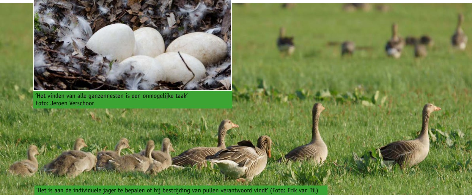
'Het is aan de individuele jager te bepalen of hij bestrijding van pullen verantwoord vindt'