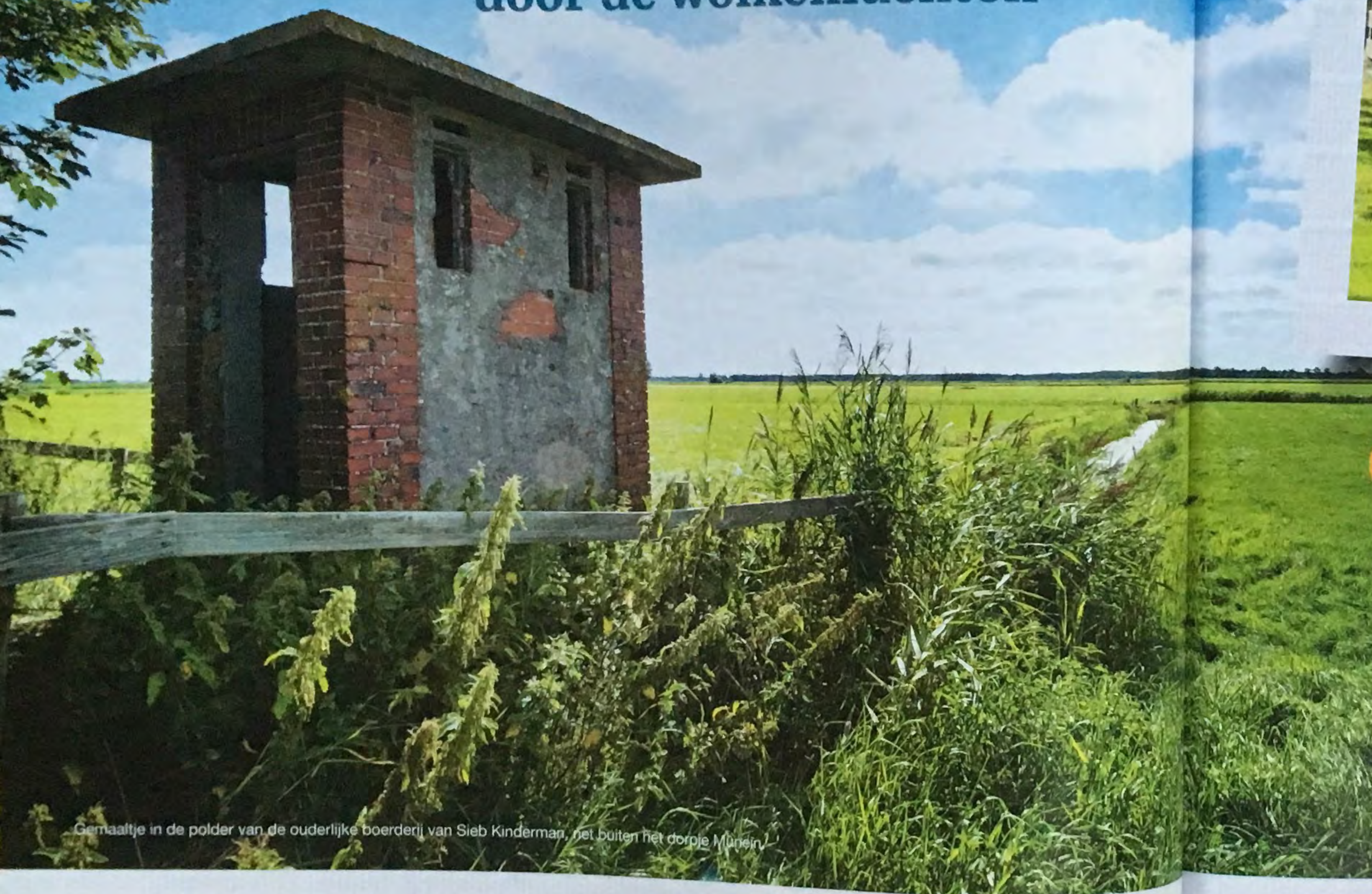
Gemaaltje in de polder van de ouderlijke boerderij van Sieb Kinderman, net buiten het dorpie Mûnein.

‘Ik wil de wind om mijn oren horen ruïsen en mij laten overweldigen door de wolkenluchten’