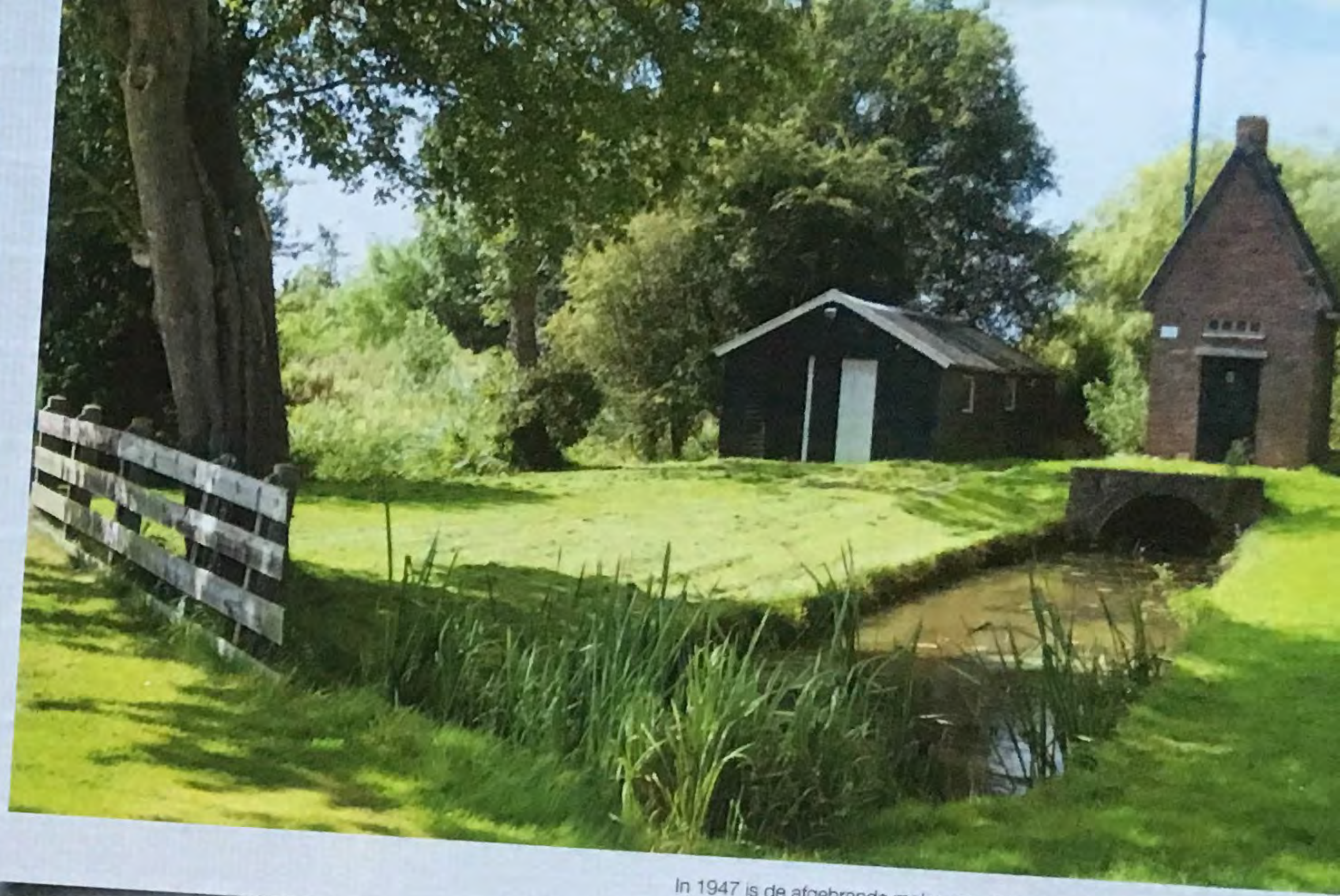
In 1947 is de afgebrande molen van Jistrum vervangen door dit gemaal.