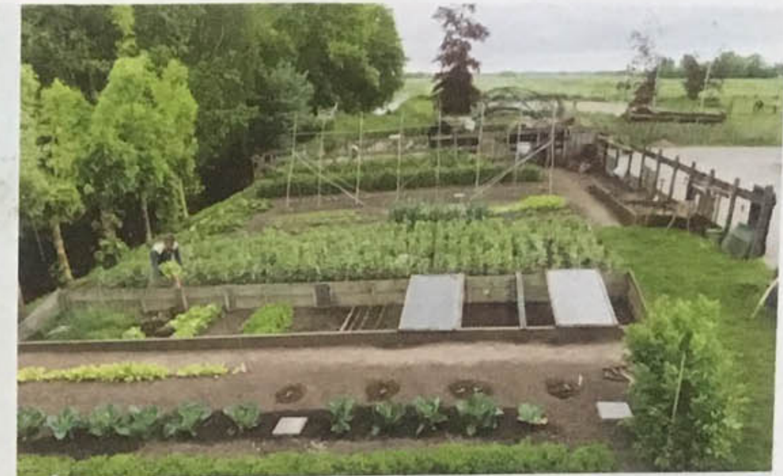
De moestuin is om door een ringetje te halen. Geen onkruidje te vinden.