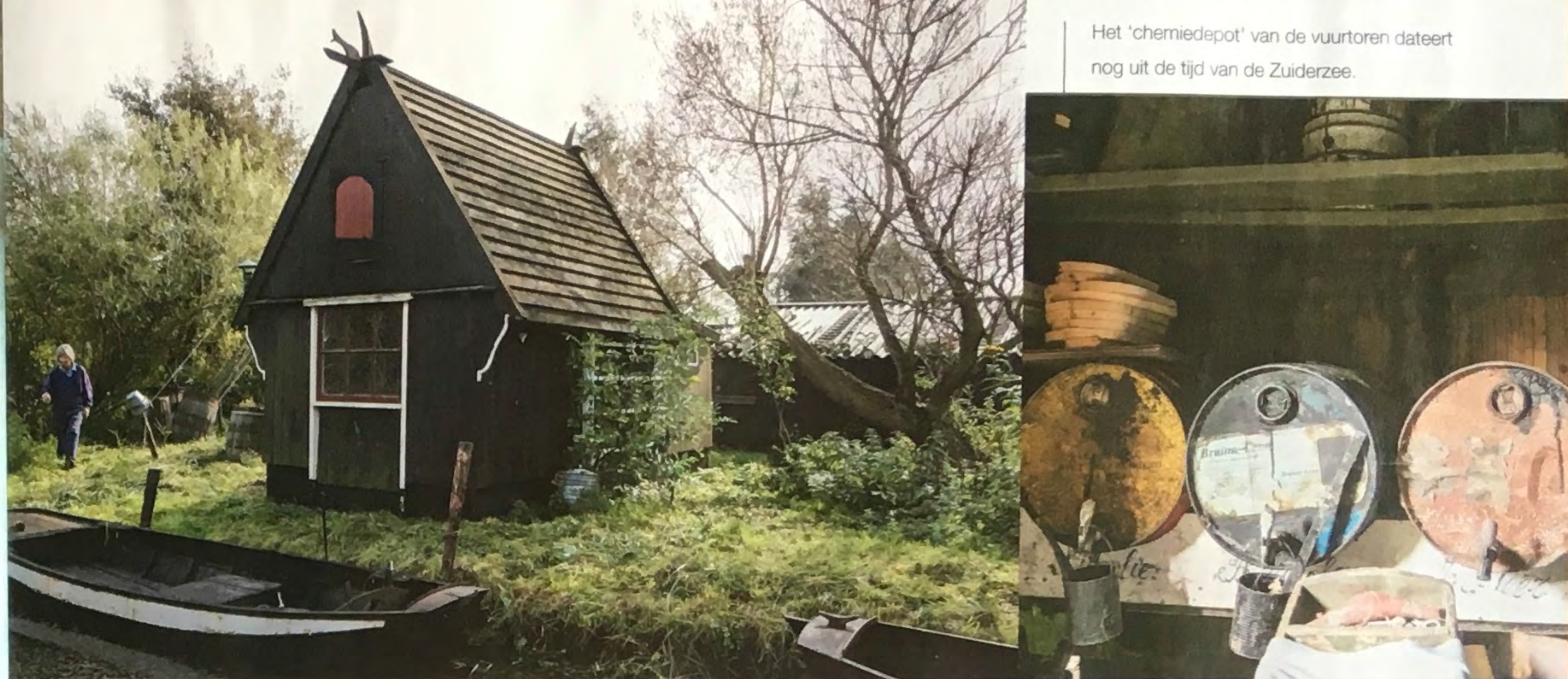
Het 'chemiedepot' van de vuurtoren dateert nog uit de tijd van de Zuiderzee.

Op het erf staan tal van hutjes. "Iemand vergeleek dit met het Openluchtmuseum, alleen wordt hier echt geleefd."