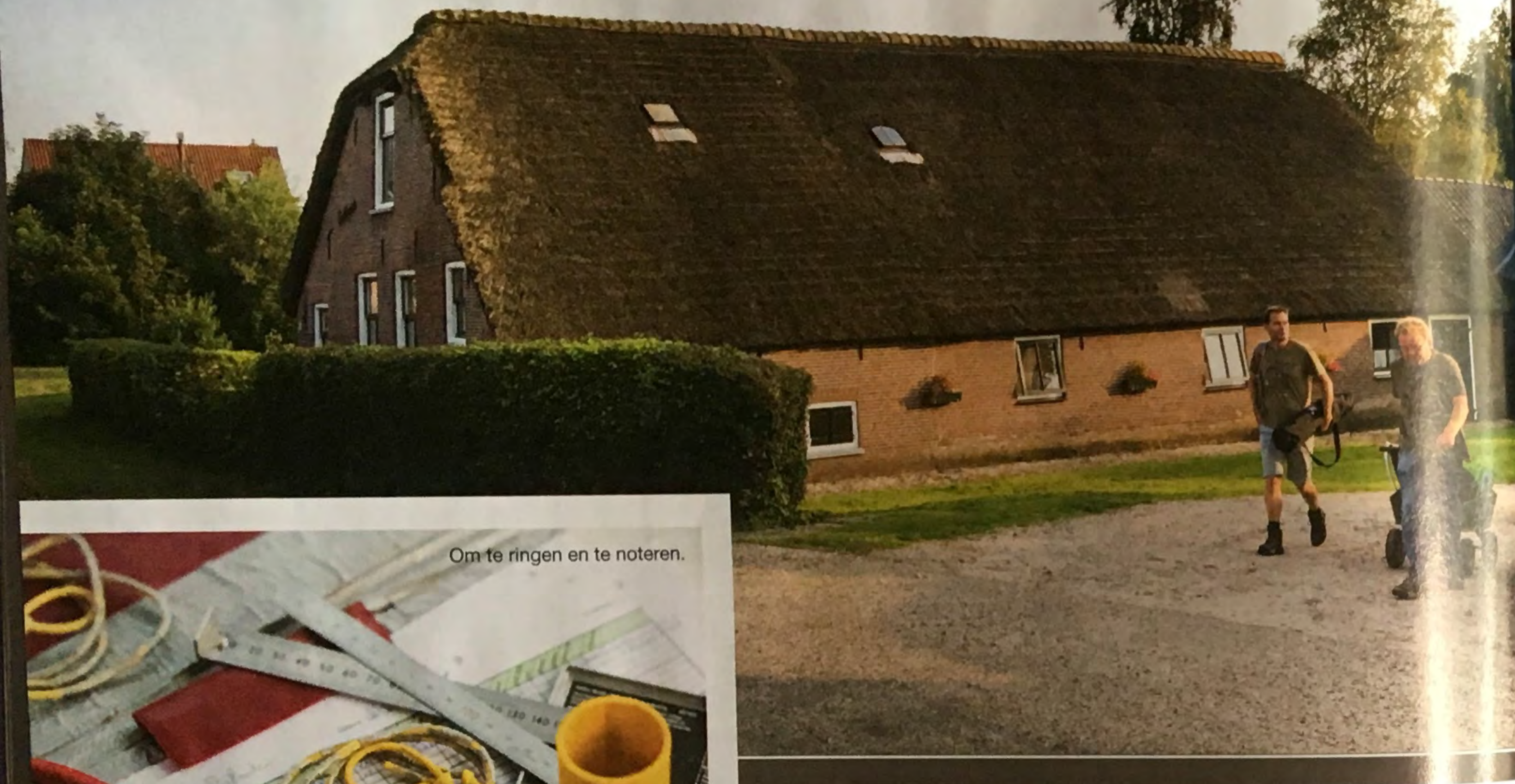
Om te ringen en te noteren.