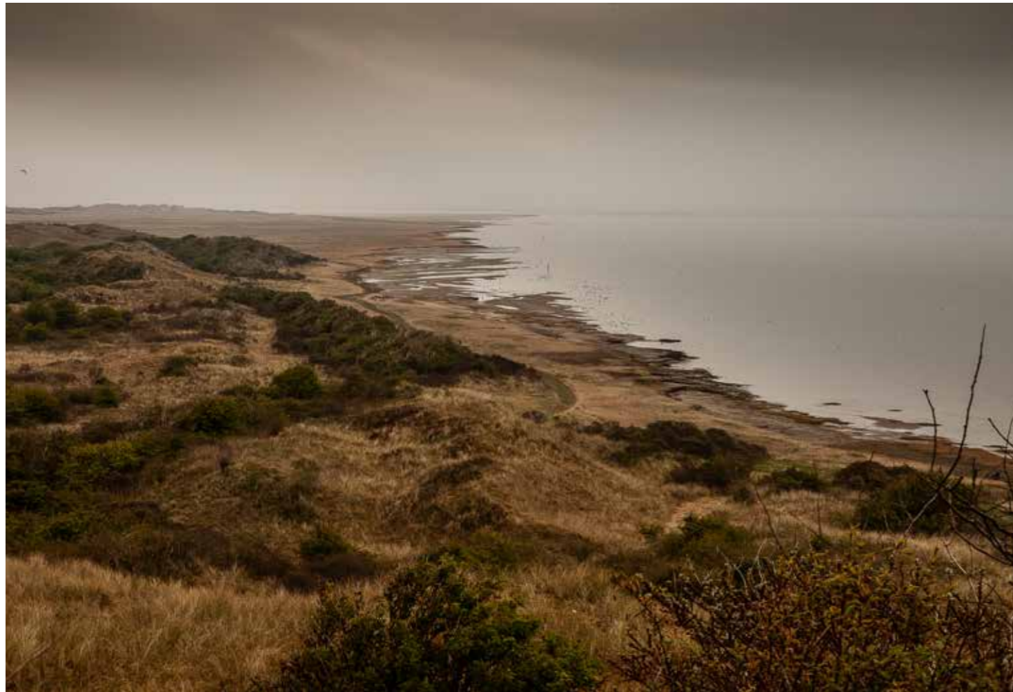
Uitzicht (vanaf het hoogste punt van Ameland) op het Wad richting Schiermonnikoog

mensen zijn te weinig geïnteresseerd om zich erin te verdiepen. Die denken dat het allemaal wel meevalt met die stikstofuitstoot. Net als ze dachten dat het wel meeviel met dat DDT.'