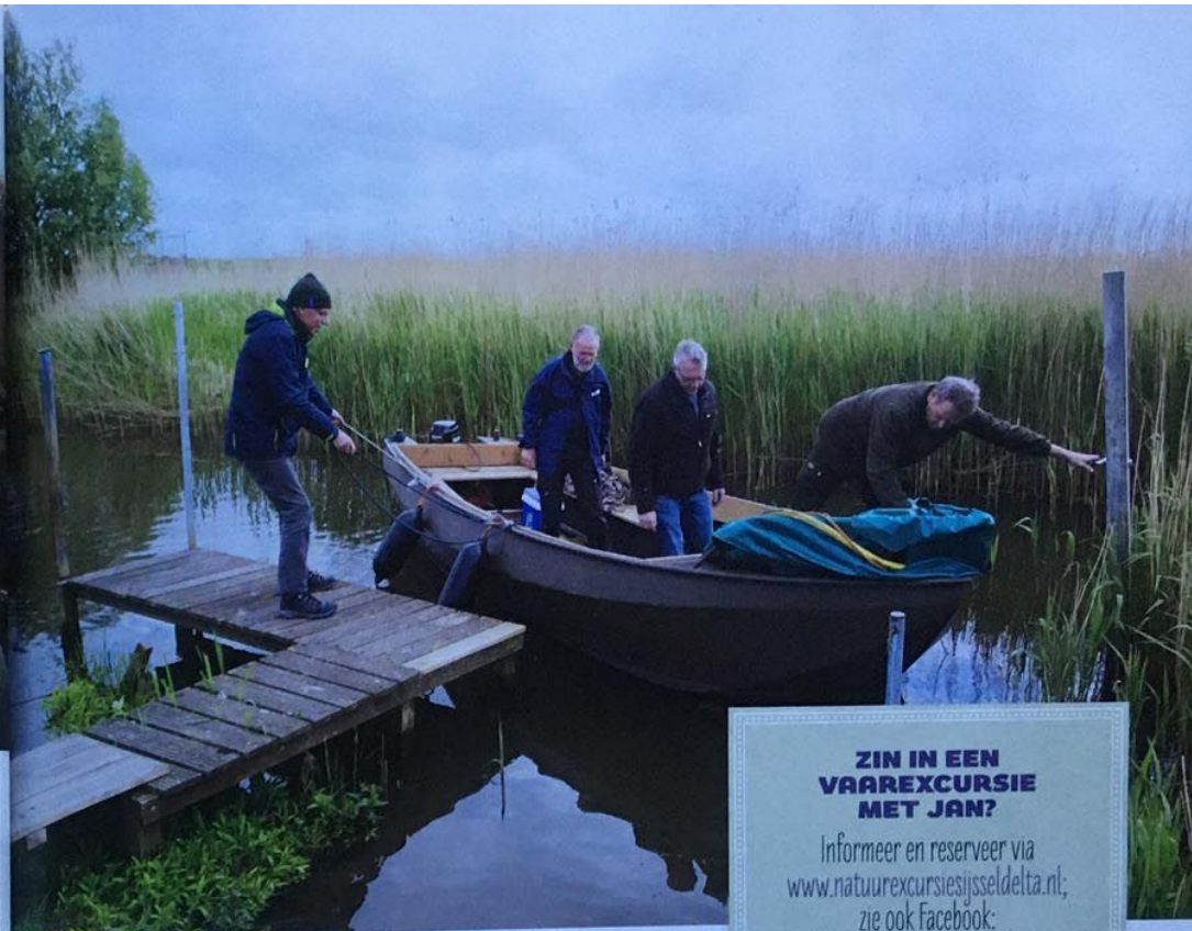
Bij het aanmeren stuift een meerkoet weg.