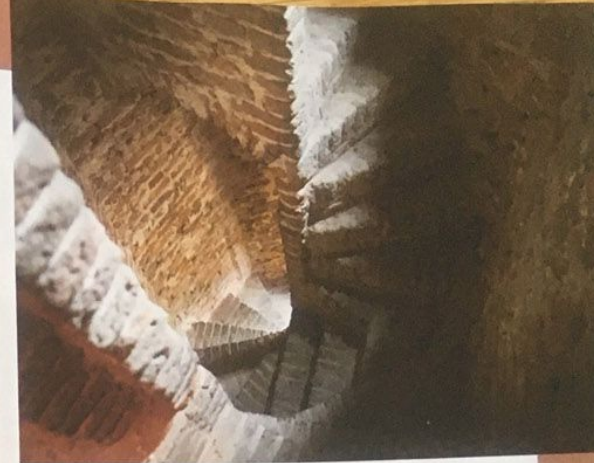
De nauwe middeleeuwse trappang.