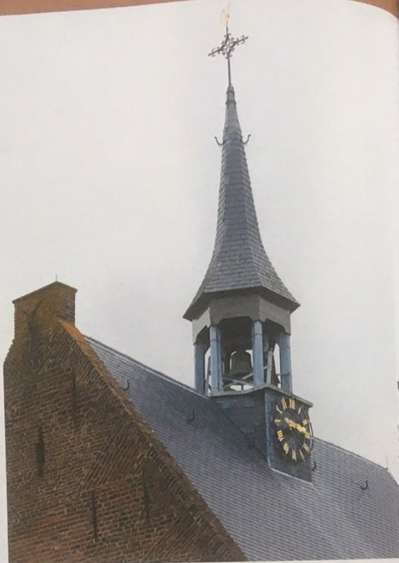
"Het kerkklokje geeft verbinding."