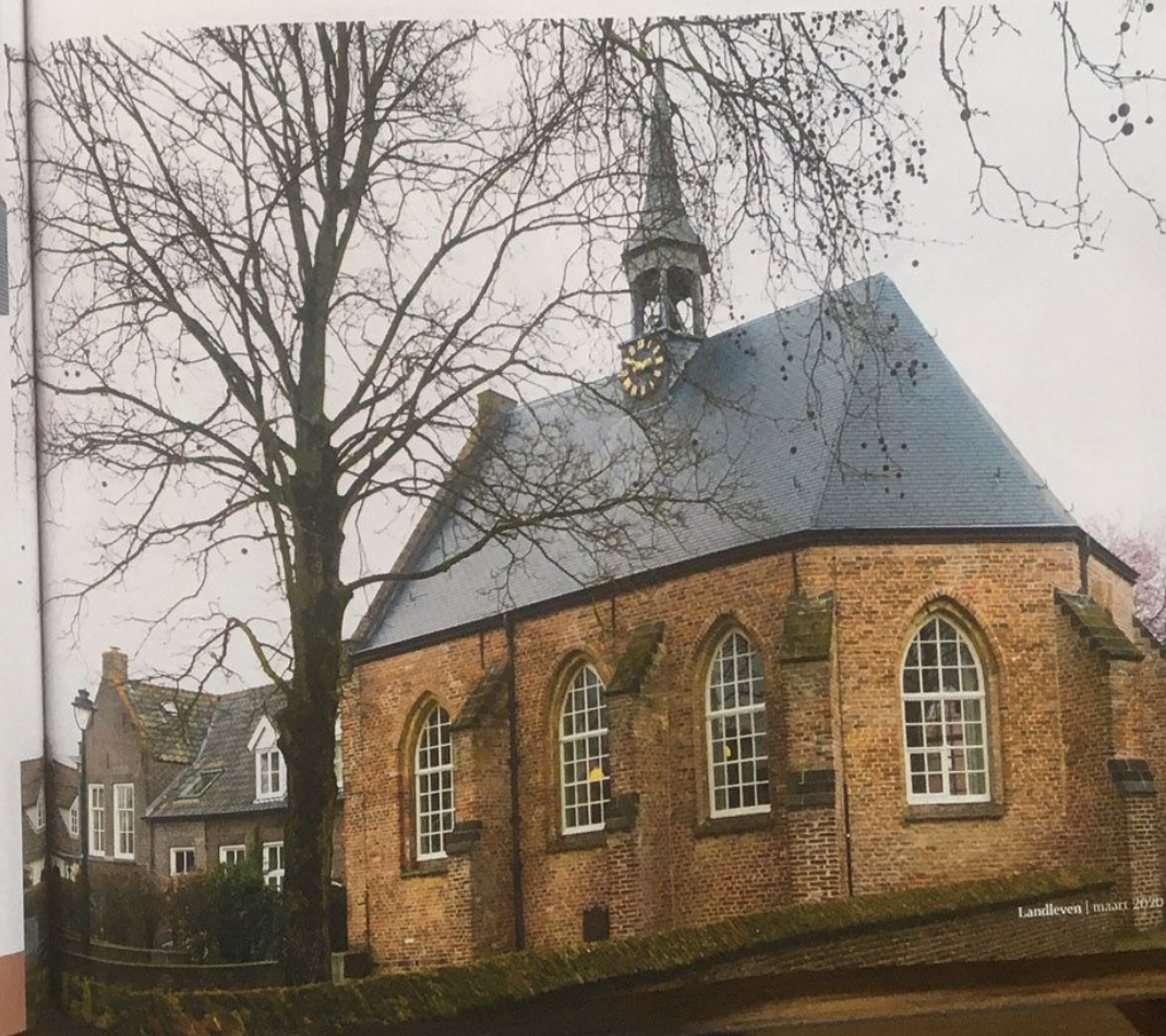
Een schattig kerkje met plek voor zo'n negentig kerkgangers.