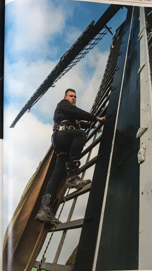
De bruine zeilen van poldermolen De Puollen zijn klaar.