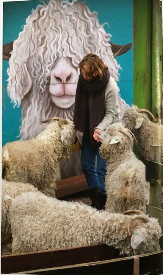
De angorageiten hebben een bloedhekel aan nat en windig weer.

helemaal verdwenen. Alleen op Texel is nog een kleine wolfabriek. Het zou mooi zijn als er in Nederland weer met respect naar wollen producten wordt gekeken. De kledingindustrie in de productielanden is zeer vervuילend. Haast niemand die dat weet; alleen de olie-industrie stoot meer kooldioxide uit. Fast fashion-bedrijven komen iedere zes weken met een nieuwe collectie. Vroeger was dat twee keer per jaar. Kleding is een wegwerpartikel geworden. Er wordt nu al twee keer zo veel kleding geproduceerd als in het jaar 2000. Het is tijd voor een herwaardering van producten die we zelf lokaal en duurzaam kunnen maken, zoals wollen kleding. Wist je trouwens dat je onze wollen truien amper hoeft te wassen? Wol heeft een zelfreinigend vermogen. Buiten luchten is veel effectiever. Dat scheelt ook weer een hoop energie. Als je dan toch wast: één keer per jaar op 30 graden is voldoende."