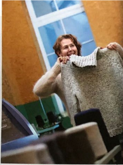
"Wij maken truien die minimaal tien jaar meegaan en niet onderhevig zijn aan modegrillen."