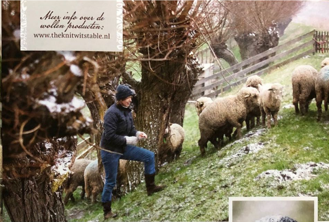
De eigen 25 merino's leveren een deel van de wol.

Meer info over de wollen producten: www.theknitwitstable.nl